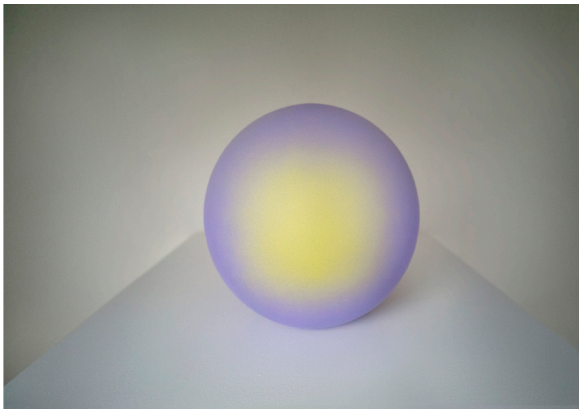
CONSUMED ABSORPTION 1 2020

De kunstwerken van Joakim Eneroth werden internationaal tentoongesteld en maken deel uit van grote collecties over de hele wereld. Hij werd regelmatig gepubliceerd in kunstboeken van gerenommeerde uitgeverijen. Hij heeft ook talloze subsidies en prijzen ontvangen. Joakim Eneroth woont en werkt in Zweden in de stad Stockholm.