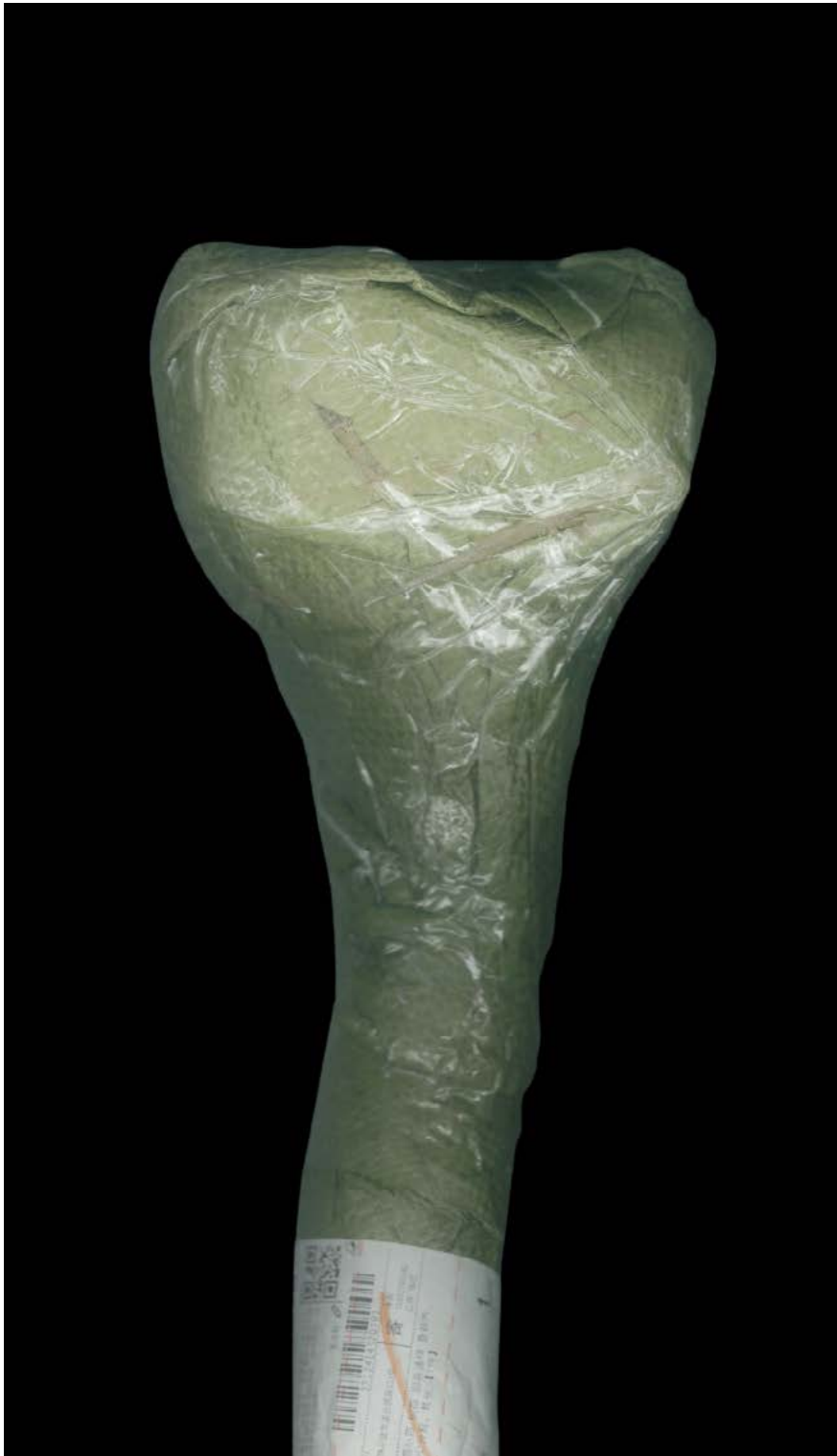
SCEPTER 2019 (VIDEO STILL)

SINGLE CHANNEL VIDEO, 1'25", EDITION OF 3