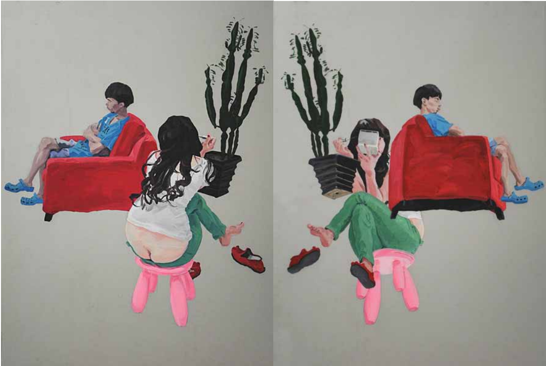
双栖（正面和反面）（2009） 130 x 93 cm ●油彩 PC 片