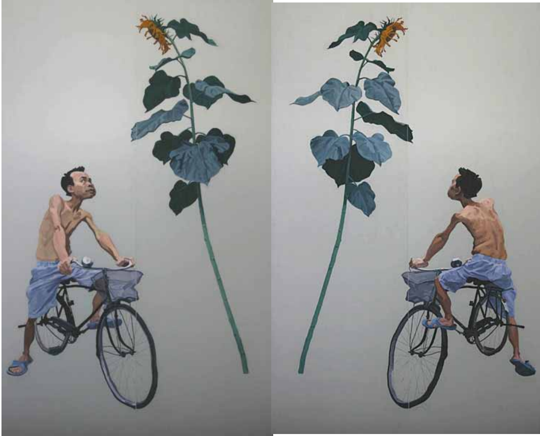
青年与向日葵（正面和反面）(2008)