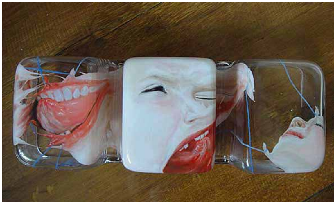
整容 1 (2011)