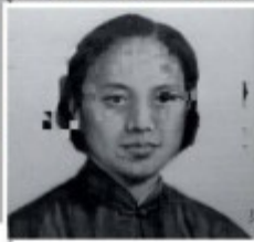
1. EAST VILLAGE, BEIJING, 1994, RONG RONG. 2. YANG XUN. 3. QEN GA ET SON TROUPE. 4. COASTLINE N°2, XIAO ZHANKANG. 5. PARENTS I, DAI GUANGYU, 2012.