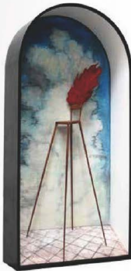
BURNING CHAIR, 2010 © WU JUNYONG