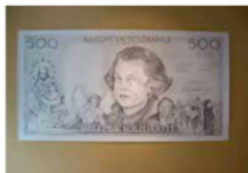
BANQUE DE TOLÉRANCE 2010 © FILIP MARKIEWICZ

> 25/6, Aeroplastics, www.aeroplastics.net