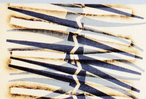
Georges Collignon, sans titre, collage sur papier, années 1950/1960.