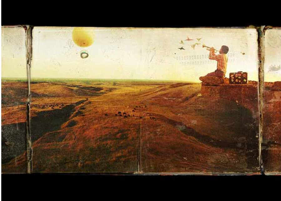
© Petr Lovigin °CLAIR Galerie. 'What a Wonderful World! My Louis!' (2012) . Archival print on Hahnemulhe paper, 40x50cm, ed.3on3. Courtesy ifa gallery (A)

Nel 2011, Petr Lovigin passa alla fotografia digitale a colori accompagnata da un complesso lavoro di fotomontaggi. Nella serie, What a Wonderful World! My Louis! , l'artista mostra i suoi paesaggi immaginari, ispirati alla sua Russia natale, su uno sfondo stampato di un libro tibetano di preghiere. Ed è all'interno di quest' universo immaginato da Petr Lovigin che un giovane Louis Armstrong, icona della musica jazz, s'incammina con una valigia alla mano.