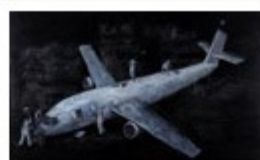
Wu Junyong

> Du 7 décembre au 16 janvier à l'ifa gallery, rue des Renards 28 à 1000 Bruxelles