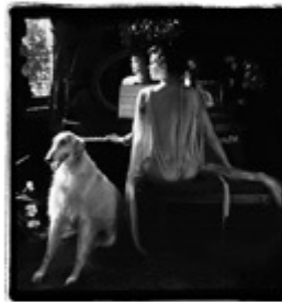
Just Jaeckin, Maccorm Gallery ©

> Du 5 décembre au 2 mars à la Maccorm Gallery, Place du Jeu de Balle 58 à 1000 Bruxelles