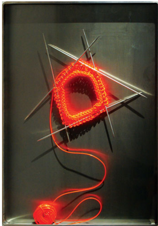
Zane Mellepe, Dowry Chest, Item No.4, the red ssock , 2011 lichtinstallatie, breien, roestvrij stalen frame, 70x50cm