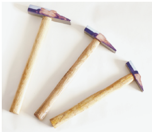
Zane Mellupe, Hammers , 2014, impression photographique sur marteaux, 45x55cm

L'art de Zane Mellupe est régulièrement exposé à la fois en Chine et en Europe dans diverses galeries et musées. L'artiste est représentée par ifa gallery depuis 2010.