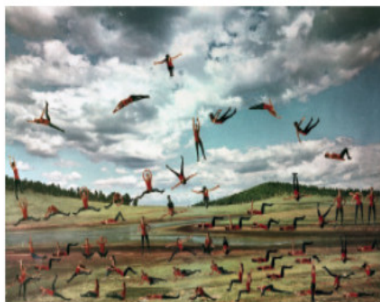
Martha Rosler, Nature Girls (Jumping Janes) de la série Body Beautiful or Beauty Knows No Pain, 1966-1972.